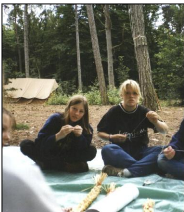
Gidsen op kamp

Het spel van scouting begint speels, bij de bevers, welpen, esta's en kabouters elk in hun 'eigen wereld'. Zo kennen de Bevers 'Huize Hotsjietonia, het huis van Lange Doener', de Welpen het 'Jungleboek van Mowgli', de Kabouters 'Bambilië' en tot slot de Esta's 't land van Esta'. Het hoogtepunt is het zomerkamp waarin een week lang rond een kamphema allerlei avonturen worden beleefd vanuit een clubhuis.