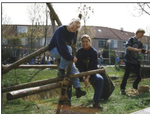
Koninginnedag in de Zuidplas

Met elkaar vormt de leiding van de speltakken de groepsraad van de vereniging Scouting St. Victor. De groepsraad is verantwoordelijk voor het