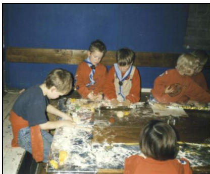
Bevers in uniform

Lid worden bij Scouting St. Victor kan op elk moment. Een aspirant-lid krijgt vier weken de tijd om te zien of het spel van scouting in de smaak valt; daarna moet hij/zij (bij minderjarigen, uiteraard de ouders/verzorgers) een beslissing nemen over aanmelding. Bij de speltakleiding zijn aanmeldingsformulieren beschikbaar.