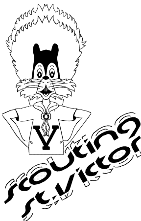
Vicky, onze mascotte

Sinds 1997 worden alle leden geregistreerd op het landelijk bureau van Scouting Nederland. Alle leden ontvangen dan ook een lidmaatschapskaart van Scouting Nederland. Deze kaart biedt ook vele voordelen, waaronder korting op artikelen die scoutingleden interessant vinden. In Scouting Magazine staan geregeld dergelijke aanbiedingen vermeld.