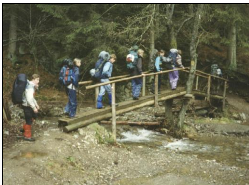
Bivak (Hike) van de R/S

Alle leden dragen het uniform. Waar nodig en mogelijk bemiddelt het speltakkader bij het aanschaffen van het uniform tussen ouders/verzorgers onderling. De benodigde tekens, zoals insignes en speltak onderscheidingstekens, die uitsluitend via de scoutshop verkrijgbaar zijn, worden (op kosten van het lid) door het kader ingekocht. De aan Scouting St. Victor verbonden groepsdas en de voor onze groep ontworpen sweaters, t-shirts en clubemblemen, worden via de "eigen" winkel te koop aangeboden.