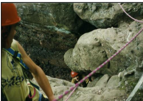
De R/S: Klimmen in België

Tot slot de Stam en Stam+ . Deze kennen geen leiding, alleen een speltak bestuur. Zij kunnen volledig hun eigen programma bepalen.